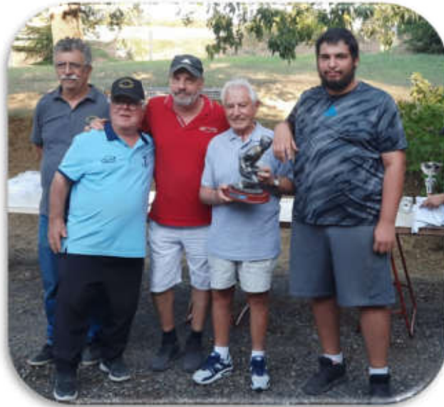
LES VAINQUEURS AVEC MONSIEUR LE MAIRE

La saison prochaine débutera en janvier par la prise de licence, alors n'hésitez pas à nous contacter.